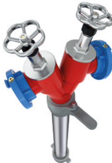
Kopf drehbar Swivel head